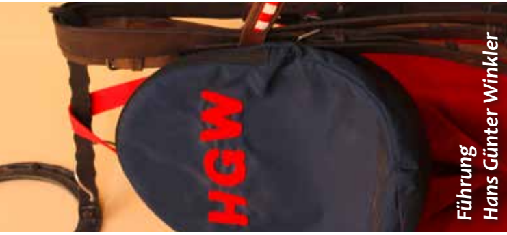
Führung Hans Günter Winkler