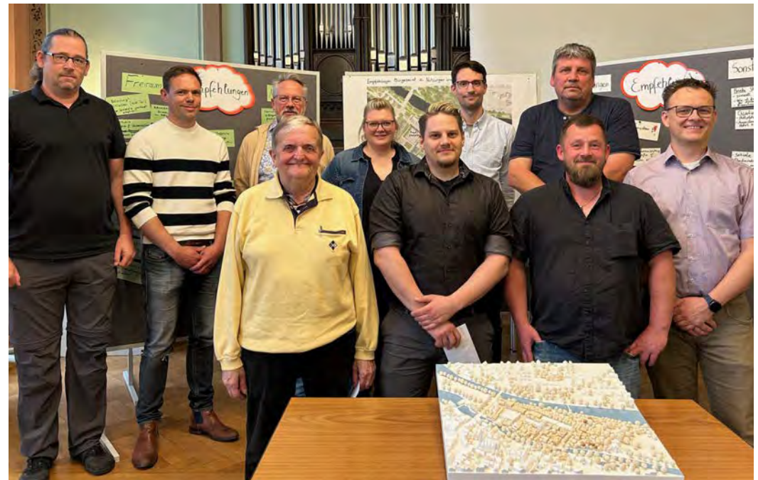
Workshop Bürger*innenbeirat | 24.05.2024