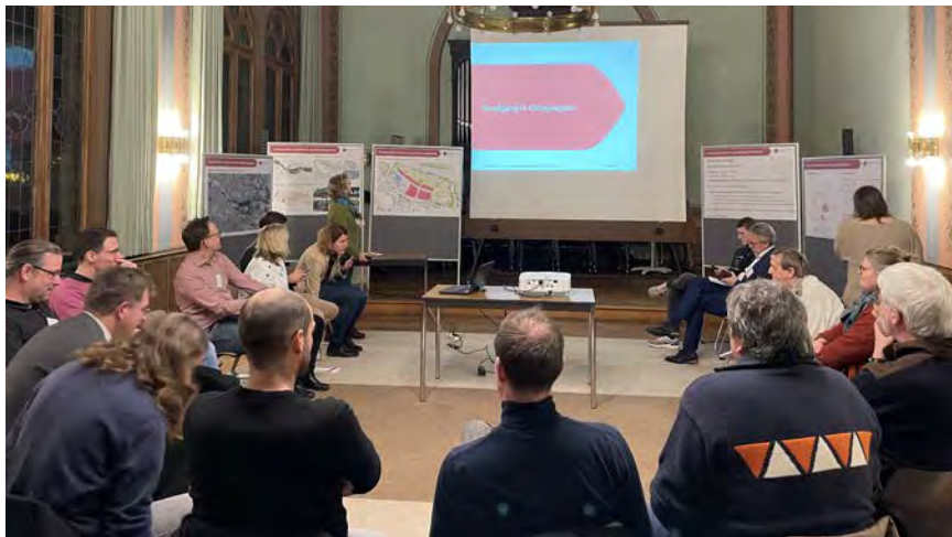
Informationsveranstaltung | 22.01.2024

Im Rahmen des Workshops konnten die Bürger*innen ihre Verbesserungsvorschläge und Empfehlungen formulieren. Die Ergebnisse sind in der vorliegenden Dokumentation festgehalten und werden an das Wettbewerbsgewinnerteam weitergegeben. Diese Anregungen werden zusammen mit den Empfehlungen des Jugendparlaments sowie des Preisgerichts bei der weiteren Erarbeitung des Masterplans berücksichtigt.